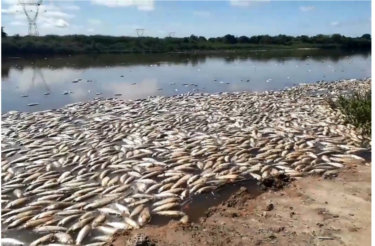
Figura 2 . Fuente: Tiempo Argentino. 20 de Enero 2021. Artículo de Gastón Rodríguez. Peces muertos del río Salado en Santa Fe, en cantidades nunca vistas. Investigadores de la Universidad Nacional del Litoral encontraron glifosfato y clorpirifos en las muestras de agua y tejidos.

La legislación argentina es muy laxa en este sentido, en relación a otros países. Por ejemplo, existen en la actualidad 107 agrotóxicos prohibidos en al menos un país, que se utilizan en Argentina. Por otro lado, si bien la Ley Nacional de Ambiente prevé la estipulación de presupuestos mínimos de protección a nivel nacional, no existe todavía ninguna Ley Nacional que regule el uso de estos productos en todo el territorio nacional. De este modo, salvo las localidades donde se han dado intensas luchas por parte de los vecinos afectados y se han logrado algunas ordenanzas municipales restrictivas, casi no existen restricciones al uso de estos productos.