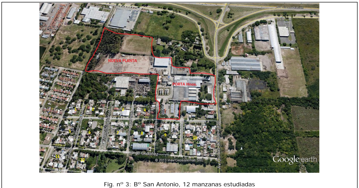
Fig. n° 3: B° San Antonio, 12 manzanas estudiadas

La encuesta permitió recoger información en 104 hogares-viviendas (67%, del todas las casas sin contar talleres y comercios) distribuidos en las 12 manzanas del barrio (ver figura n° 3). Cuenta con información de 416 vecinos (74,2% del total de los habitantes del barrio según censo 2008 2 ), 51,3% de sexo femenino y 25% menores de 15 años.